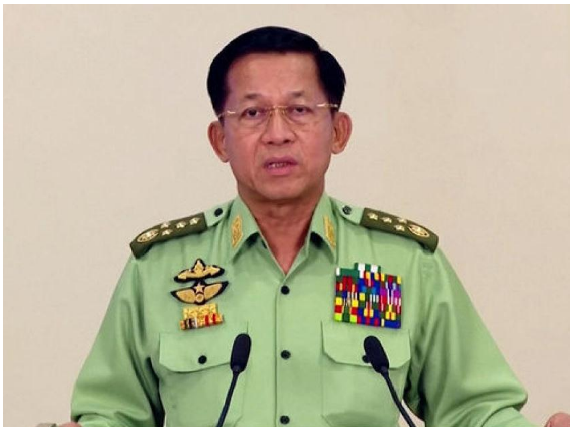
General Min Aung Hlaing

Importantes logros están alcanzando los rebeldes, en la guerra civil de Birmania, tras el inicio de la Operación 1027 (por el diez de octubre del 2023) fecha que marcaba el comienzo de la ofensiva lanzada contra el poderoso Tatmadaw , (Ejército de Birmania) por parte de la Alianza de las Tres Hermanas (3BHA), compuesta por el Ejército de Arakán (AA), el Ejército de la Alianza Democrática Nacional de Myanmar (MNDAA) y el Ejército de Liberación Nacional de Ta'ang (TNLA), que junto a una importante cantidad de grupos étnicos regionales, del resto del país, se han levantado contra la junta militar, liderada por el general Min Aung Hlaing, después del golpe de