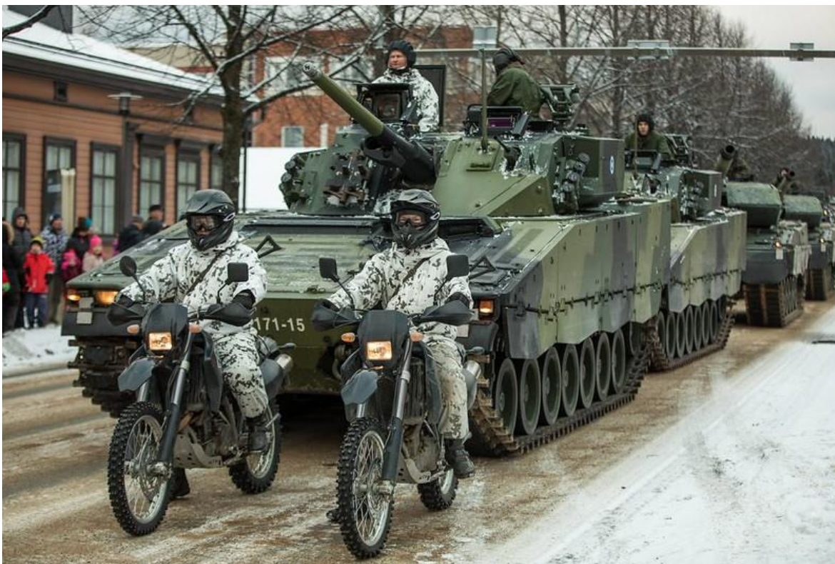
Parte del equipamiento militar de Finlandia