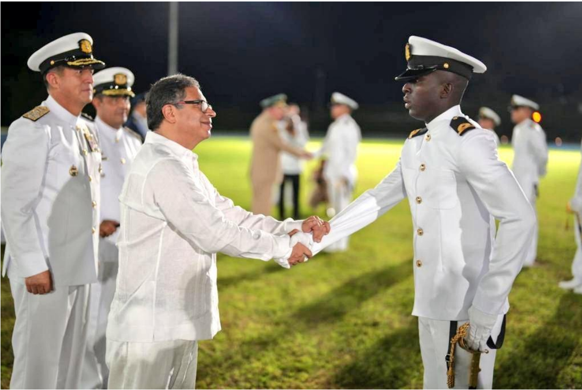
El Presidente Gustavo Petro, en ceremonia de ascenso de nuevos oficiales de la Armada Nacional de Colombia, el 03/06/2023 en la ENAP. Dice la Armada con orgullo, que entre los 96 graduandos había un afrocolombiano...

Crítica al racismo en las escuelas de formación de oficiales de las Fuerzas Militares de Colombia.