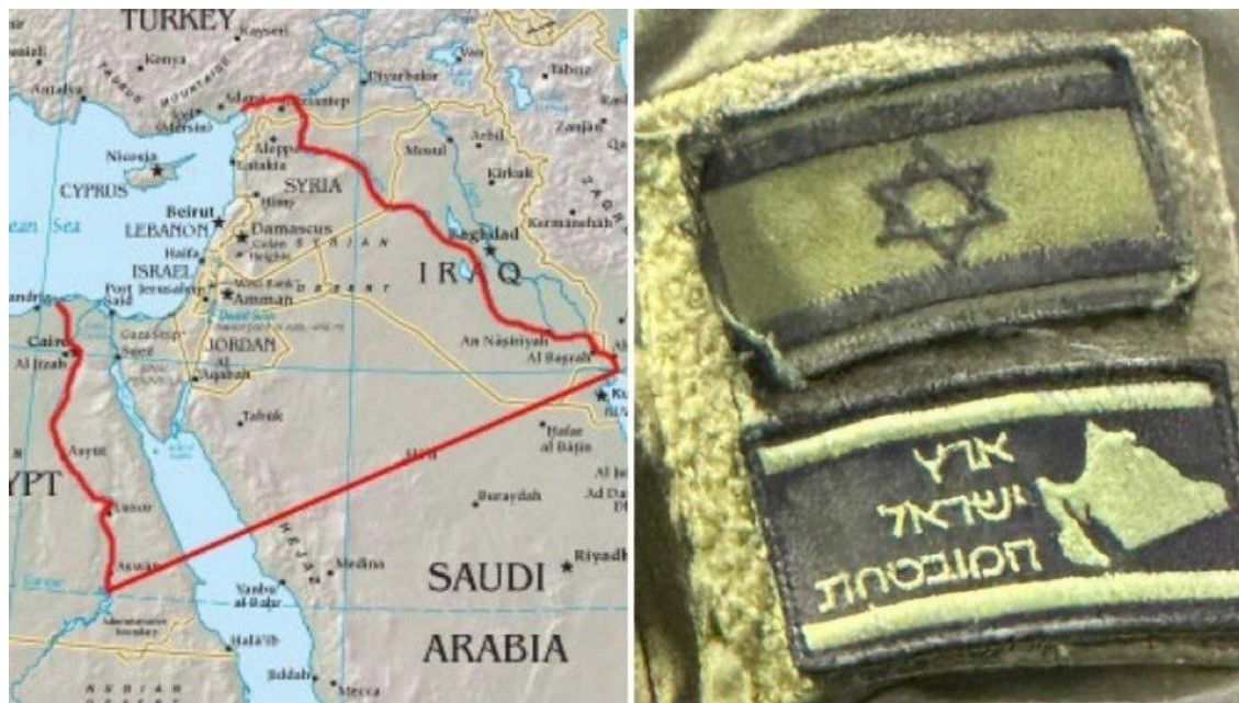
A la izquierda, en color rojo, los límites del pretendido "Gran Israel" (génesis 15:18), a la derecha parche de un soldado israelí.

A poco de cumplirse un año de la Operación tormenta de al-Aqsa , y en vista de la rápida reacción del régimen sionista , que no solo le permitió demoler Gaza, exterminar Cisjordania, sino ahora avanzar hacia la conquista del Líbano.