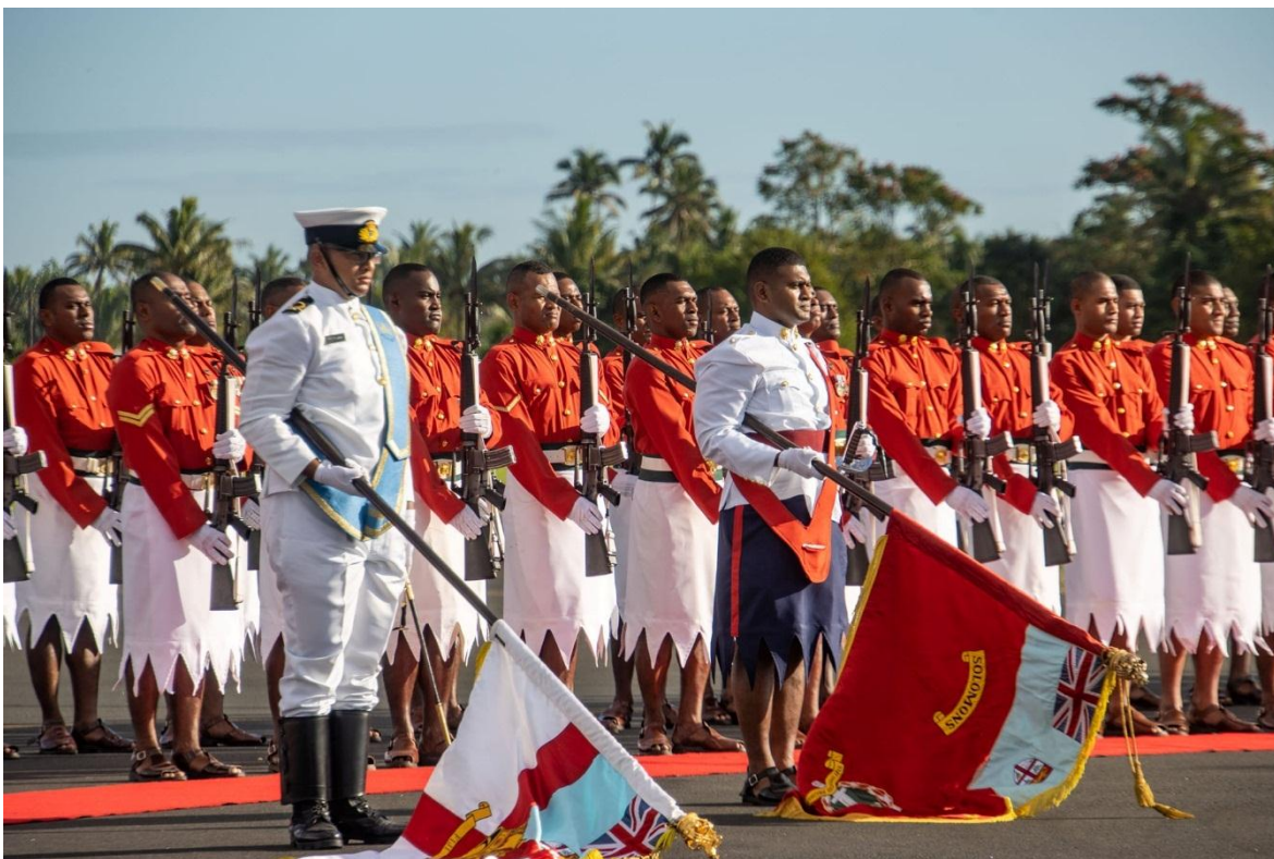
Ceremonia militar en Fiji, con uniformes que resaltan lo étnico.

Fusiles de francotirador Pindad SPR-2 Carabinas M4 de serie Carabinas CAR-15 Pistolas M45A1