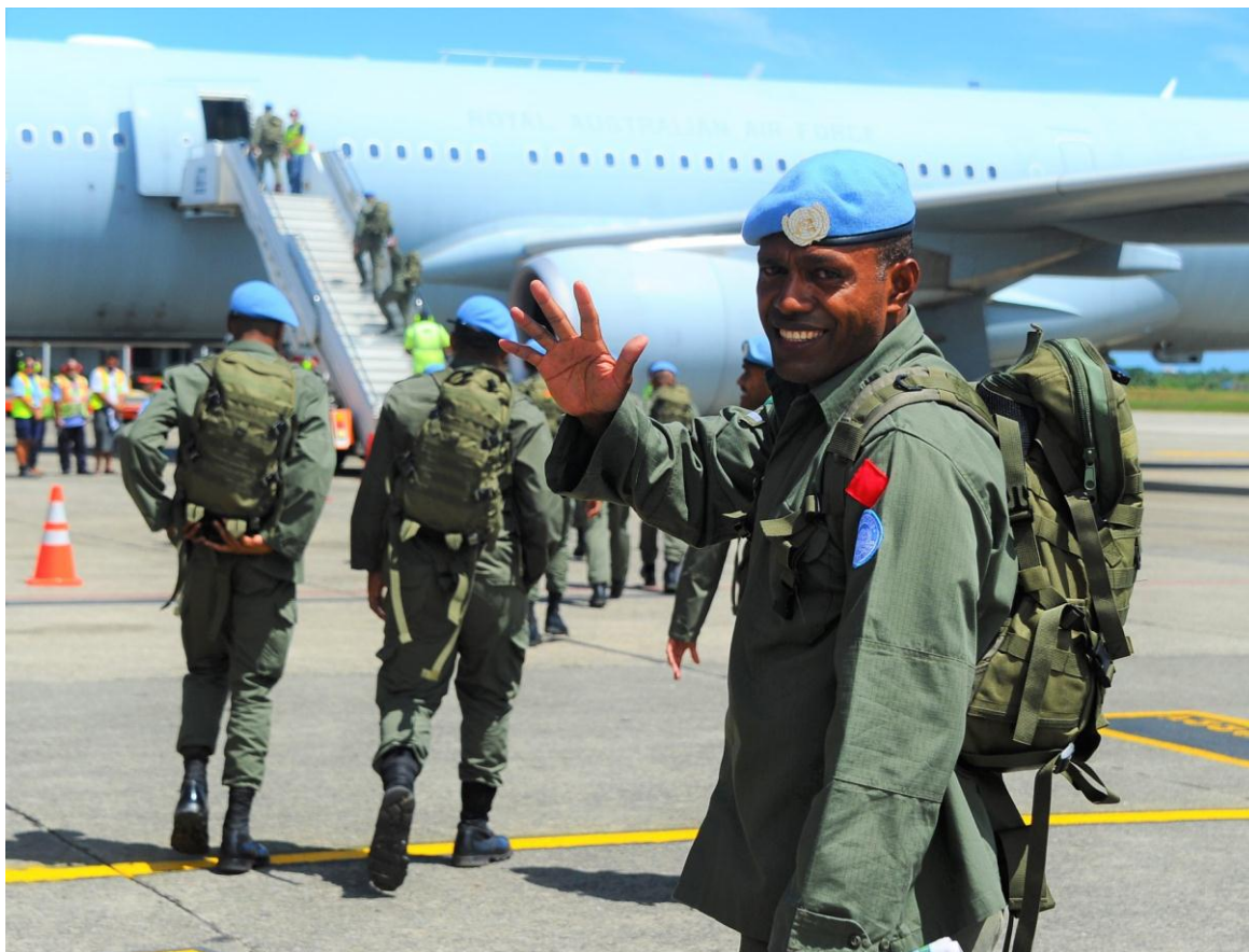
Fiji tiene desde hace años diferentes despliegues internacionales, aquí vemos cascos azules bajo bandera de la ONU.