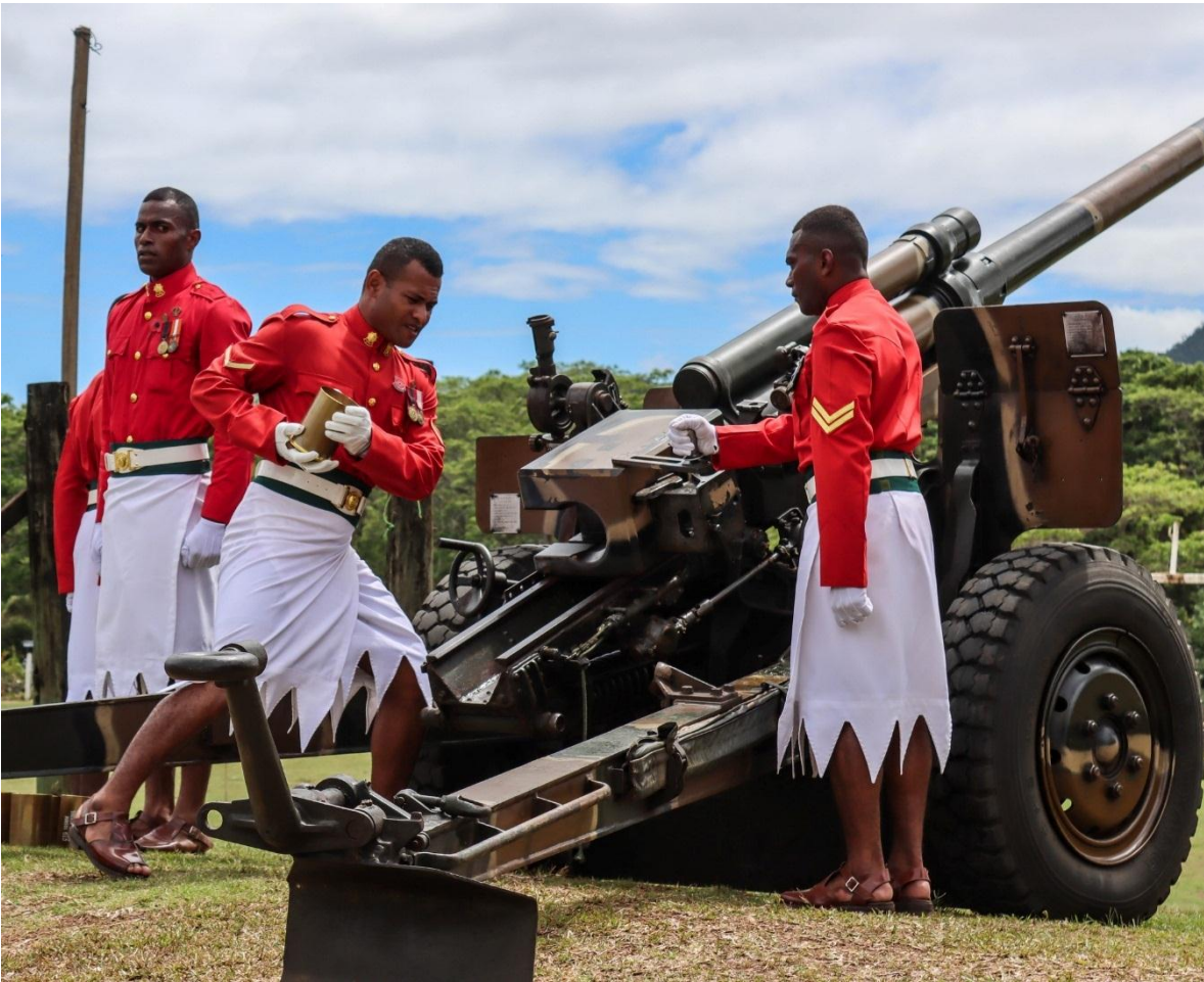
Artilleros del Ejército de Fiji, disparando salvas en una ceremonia militar.

Base naval de Walu Bay: ubicada en el embarcadero de Narain en la bahía de Suva y que se trasladará fuera de Suva.