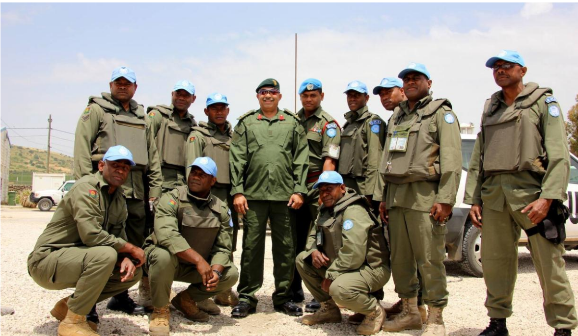
Personal de "Cascos Azules" de Fiji, con su comandante.

El 5 de diciembre de 2006, el ejército fijiano dio un tercer golpe de Estado. El 7 de febrero de 2008, el jefe de la RFMF y primer ministro interino tras el golpe, Voreqe Bainimarama, declaró: "Qarase [...] no entiende el papel de los militares y, como tal, está desinformando a la nación. [...] Si hay prácticas y políticas que tienen el potencial de socavar la seguridad nacional y la integridad territorial de Fiji, la RFMF tiene todo el derecho, en virtud de la Constitución, a intervenir". En agosto de 2009, con Bainimarama todavía controlando el gobierno como primer ministro y la constitución derogada, Epeli Nailatikau, un ex comandante militar, fue nombrado presidente interino tras la jubilación de Iloilo.