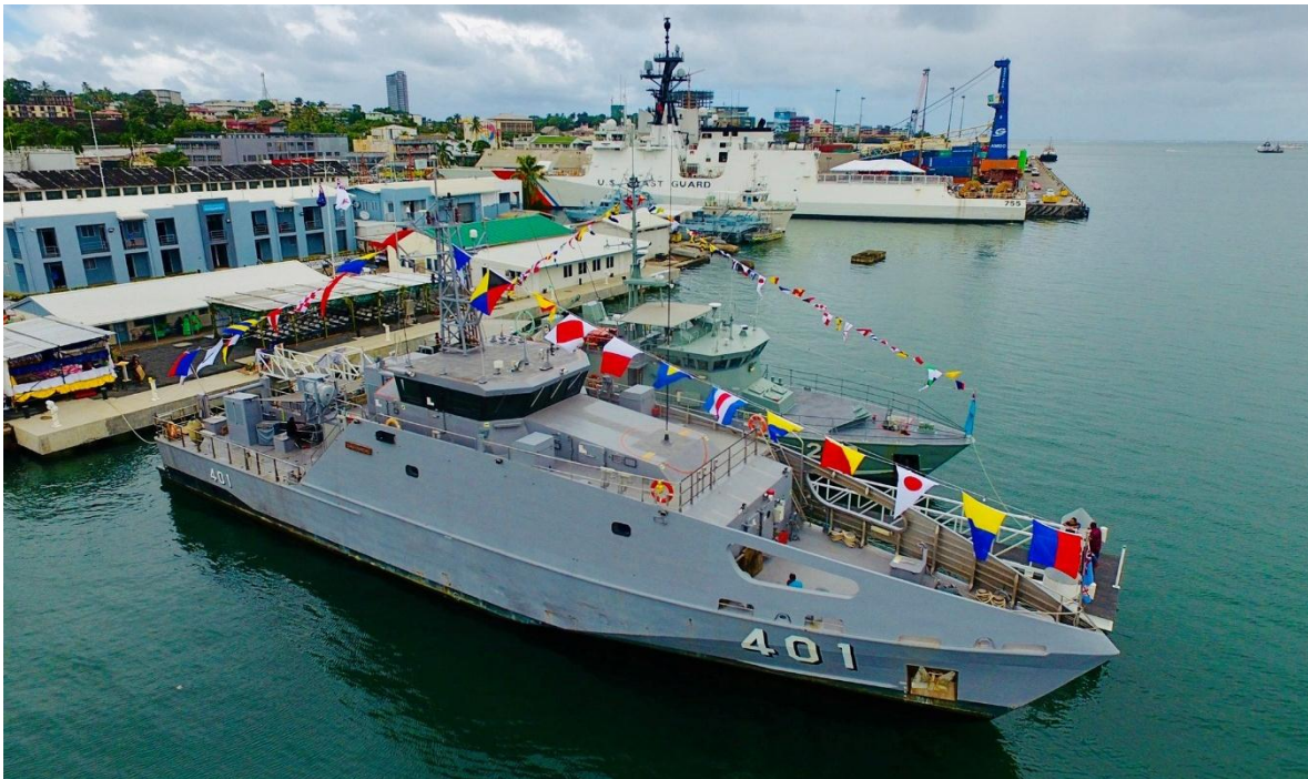
Lo más moderno de la Armada de Fiji, uno de los Guardian, el RFNS Savenaca.