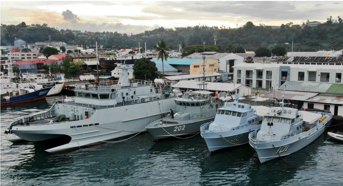
Principales unidades navales de la Armada de Fiji, el catamarán es el RFNS Kacau.

Con la independencia de Fiji en años posteriores, el 1er Batallón fue reactivado, esta vez bajo el control del gobierno independiente de Fiji. En 1978, con la resolución de la ONU para establecer la Fuerza Provisional de las Naciones Unidas en el Líbano (FPNUL), el 1er Batallón fue desplegado al inicio de la FPNUL. En 1981, tras la decisión de la ONU de no enviar una fuerza de mantenimiento de la paz a la península del Sinaí, se estableció la organización de la Fuerza Multinacional y Observadores para servir como una fuerza de mantenimiento de la paz multinacional independiente en la región. Fiji ofreció voluntariamente un batallón de infantería para servir como parte de esta fuerza, y así el 2º Batallón se convirtió de una unidad territorial a regulares. El 2º Batallón ha servido en el Sinaí con la MFO desde entonces. El 3er Batallón se estableció como una unidad regular después de los golpes de estado de 1987, para servir como la principal formación de defensa territorial de Fiji. El 3er Batallón también sirve como unidad de mando operacional para los batallones territoriales y proporciona tropas de refuerzo tanto para el 1.er como para el 2.º Batallón. El 27 de agosto de 2014, el Frente Al-Nusra capturó a 45 efectivos de mantenimiento de la paz de la FNUOS, que fueron liberados el 11 de septiembre de 2014. En marzo de 2017, los efectivos de mantenimiento de la paz de la FNUOS se desplegaron por primera vez con vehículos blindados Bushmaster.