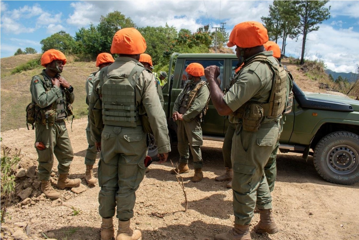
Entrenamiento de tropas que participarán en la Fuerza Multinacional de Observadores, MFO, en la Península del Sinaí.