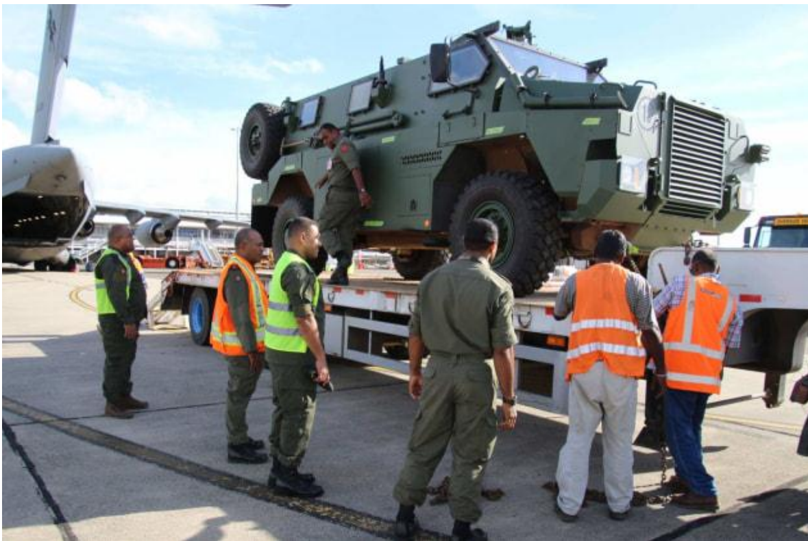
Uno de los 24 vehículos blindados Bushmaster donados por Australia a la República de Fiji.