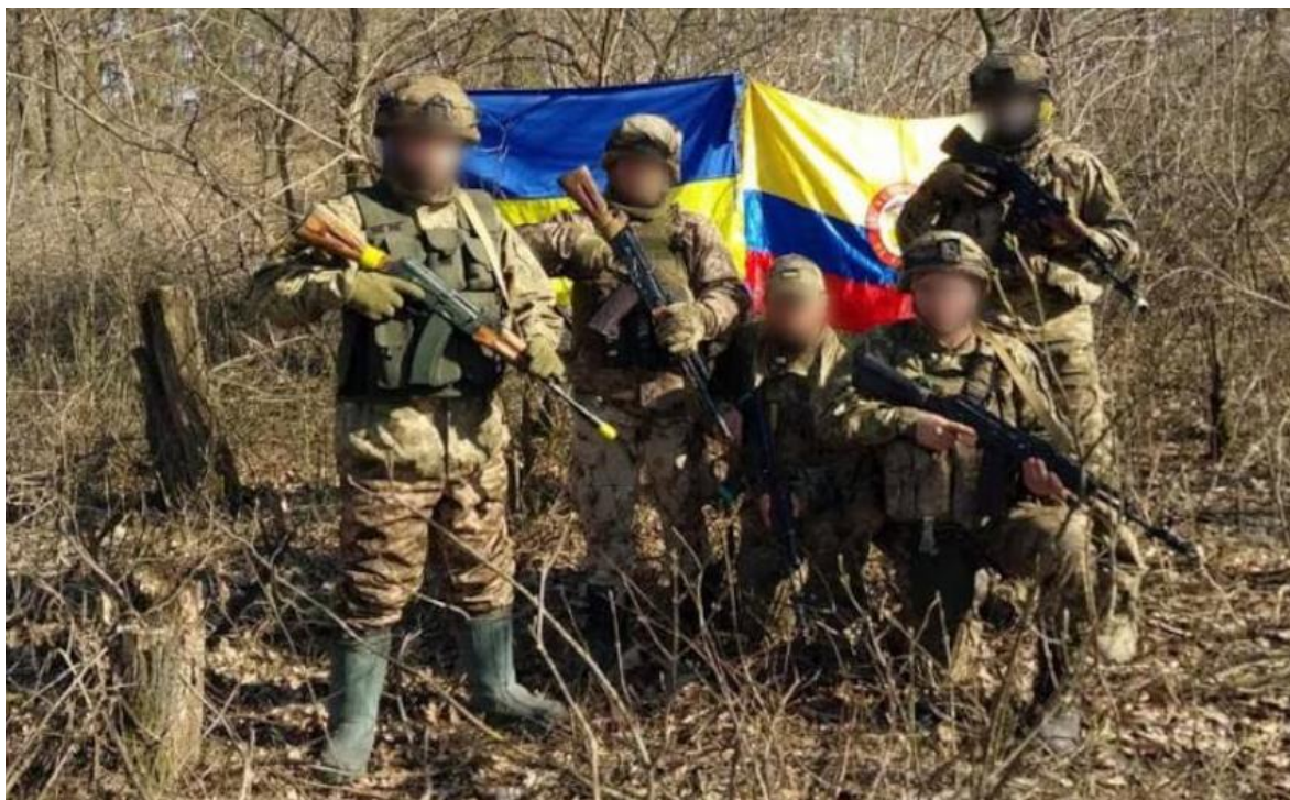
Mercenarios colombianos en Ucrania. Varios han muerto en combate, y otros están presos en Rusia, pero siguen llegando más.

El día martes 13 de agosto del 2024, a través del sistema PQRS de la página oficial de Ministerio de Defensa de Colombia, radiqué una solicitud de información / derecho de petición, en los siguientes términos: