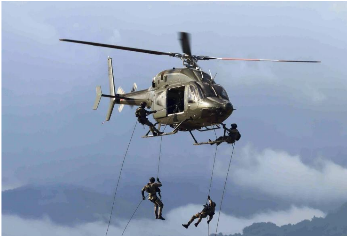
Helicóptero Bell 429 Global Ranger, del Air Wing de la Fuerza de Defensa de Jamaica, incorporado el 3 de agosto del 2018.