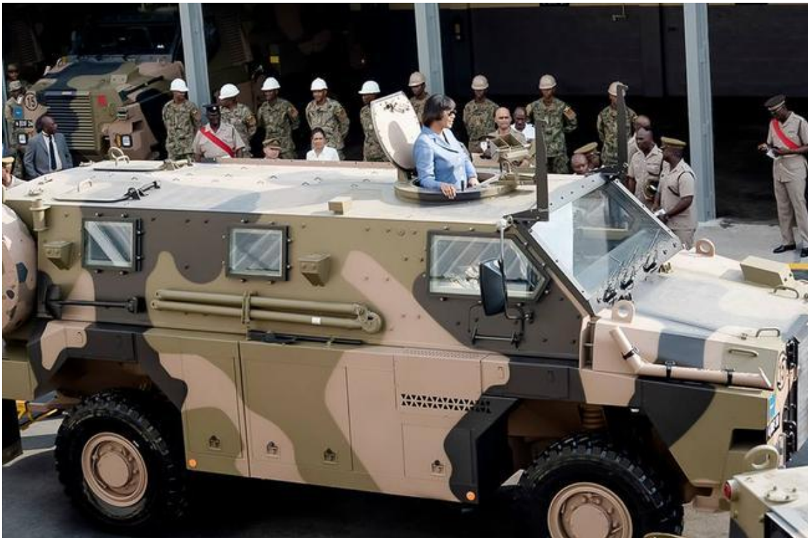
Ceremonia de recepción de los primeros vehículos Bushmaster, el 13 de enero de 2016. Adquiridos a Australia.

Banda del Regimiento de Jamaica: Esta banda se formó originalmente como la Banda del Regimiento de las Indias Occidentales, formada en 1959 como fuerza militar de la Federación de las Indias Occidentales. Con la disolución de la Federación y la independencia de Jamaica, se convirtió en la Banda del 1.er Batallón del Regimiento de Jamaica. Adquirió su nombre actual con la formación del 2.º Batallón en 1979.