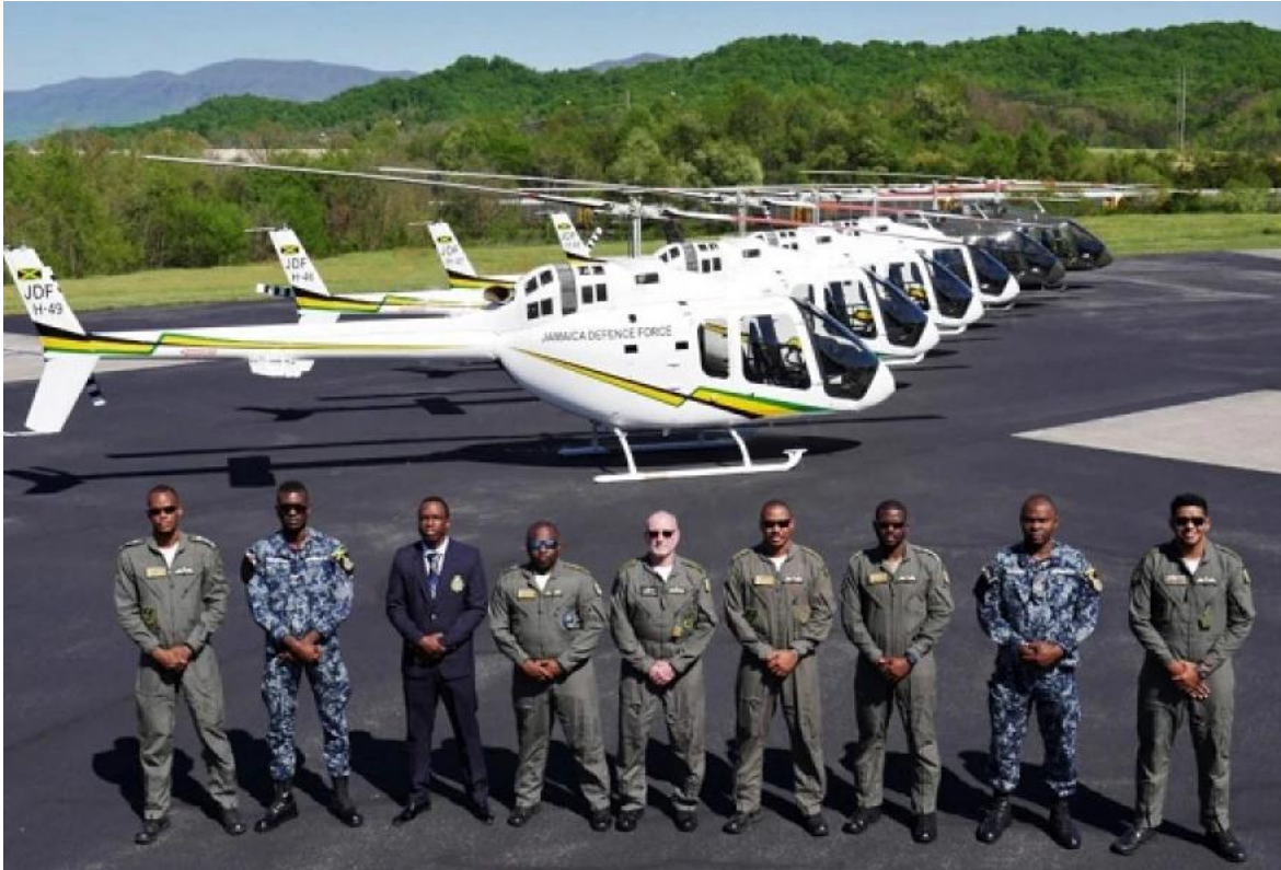
Incorporación de los helicópteros Bell 505 Jet Ranger X, el 17 de junio del 2021