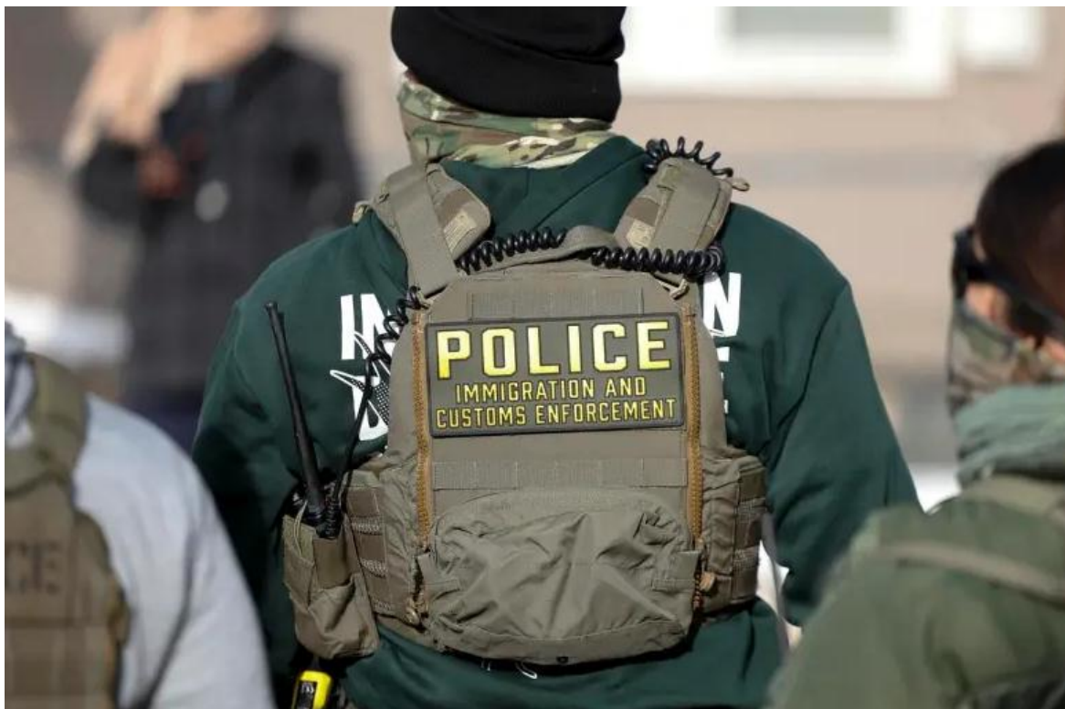
Hombres del ICE, atropellando los Derechos Humanos de la población de Minneapolis.