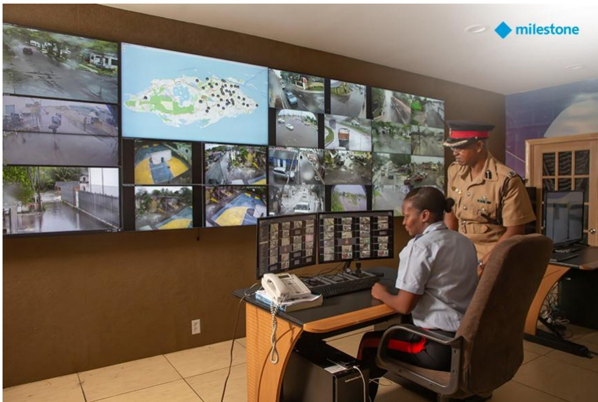
La Fuerza de Policía Real de las Bahamas emplea una plataforma de vigilancia para reducir la delincuencia y monitorear el tráfico vehicular.

Es importante que los organismos de las Fuerzas del Orden estén en plena capacidad de actuar contra el terrorismo, observando las garantías que la Constitución Federal de cada país, las leyes y los reglamentos les brindan.