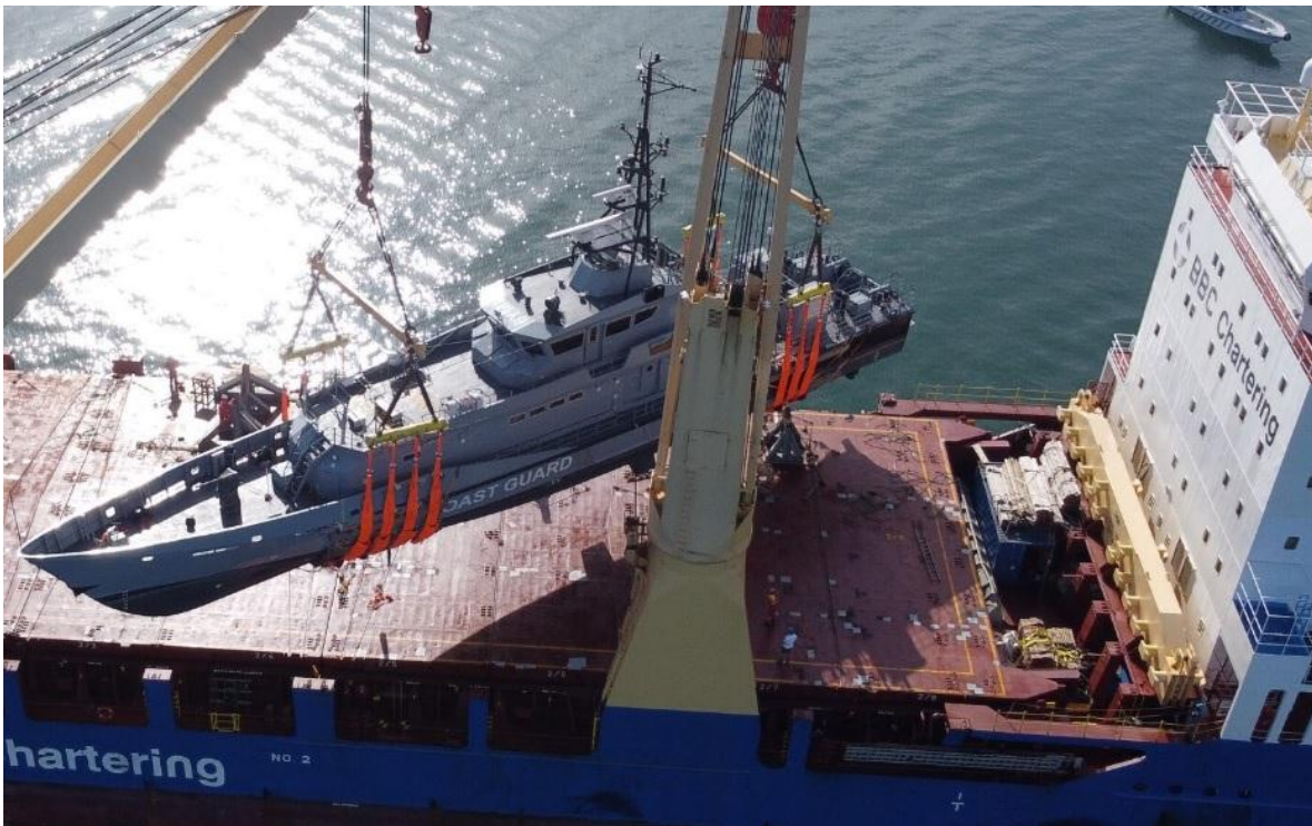
Recepción de la segunda patrullera Clase 4207, el 22 de noviembre de 2021