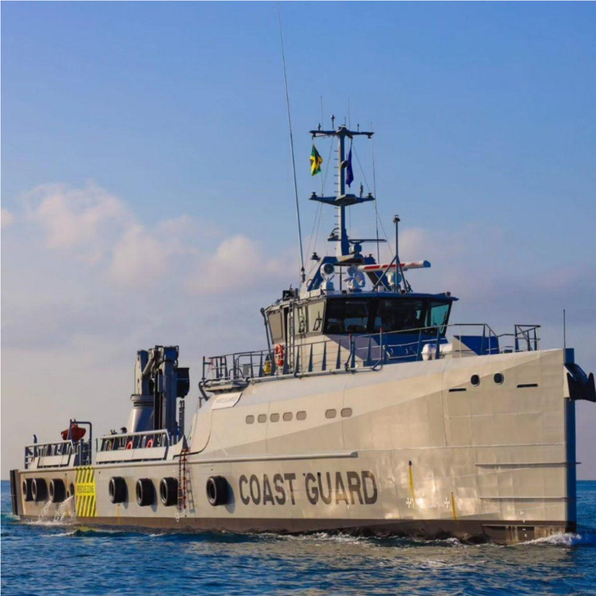
HMJS Marcus Garvey, OPV Damen Fast Crew Supplier, FCS, 5009 Patrol de la Guardia Costera (Cost Guard), rama naval del Comando Marítimo, Aéreo y Cibernético (MACC) de la Fuerza de Defensa de Jamaica (JDF)

Fuentes: https://en-wikipedia-org.translate.google.com/wiki/Jamaica_Defence_Force