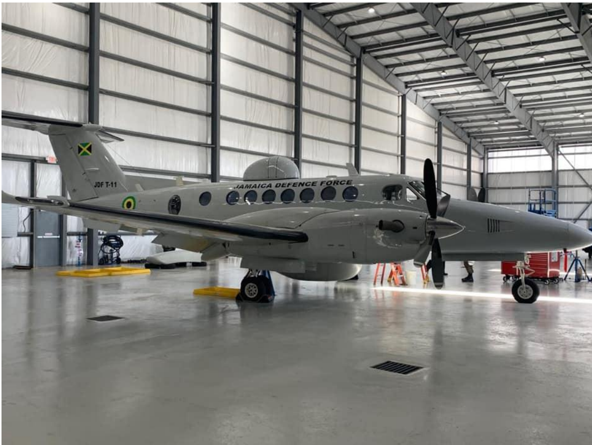
King Air 350ER de patrullaje marítimo de la Fuerza de Defensa de Jamaica, incorporado el 14 de noviembre de 2018.