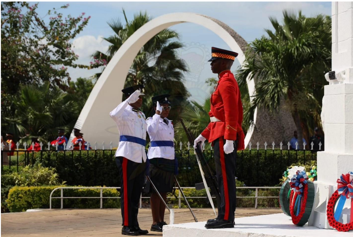
Ceremonia Militar Fuerza de Defensa de Jamaica