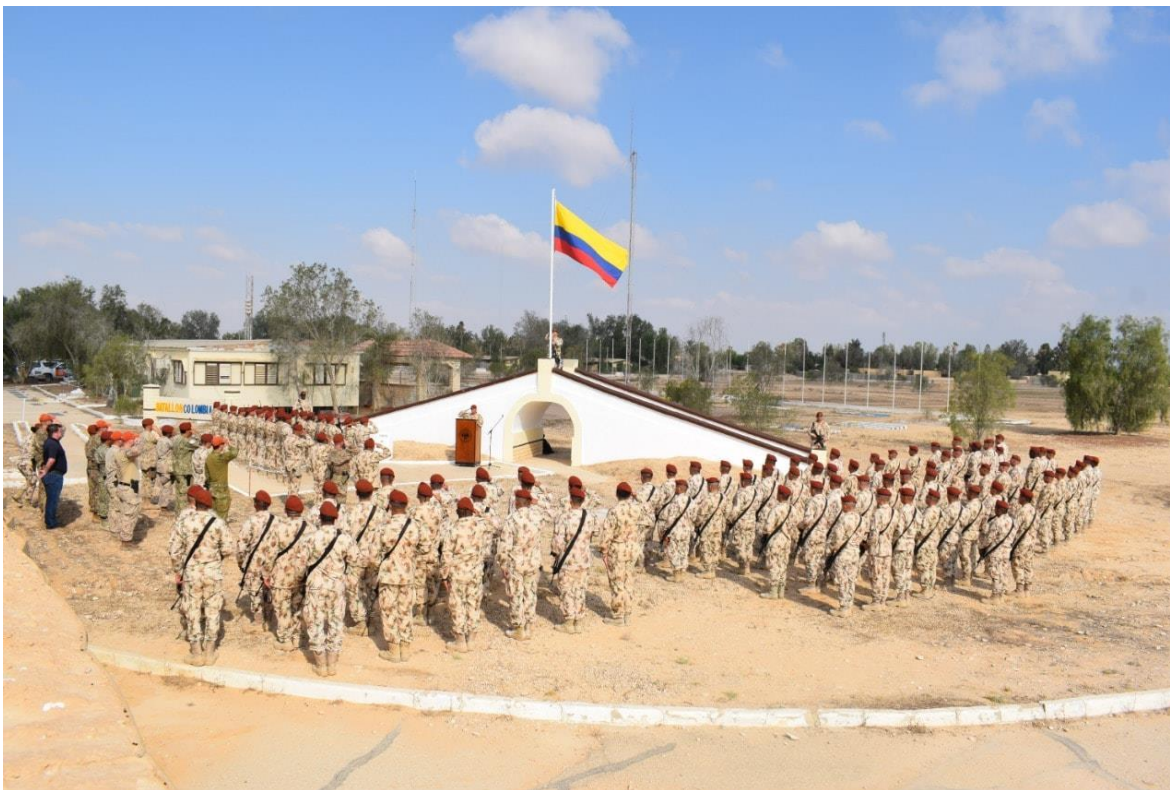
Tropas colombianas en El Gorah, península del Sinaí (Egipto). Hacen parte del Batallón Colombia N°3 que presta servicio en la Fuerza Multinacional de Observadores que propende por la estabilización y el cumplimiento del acuerdo de paz entre Israel y Egipto.

Por Douglas Hernández (Colombia) & OpenAI