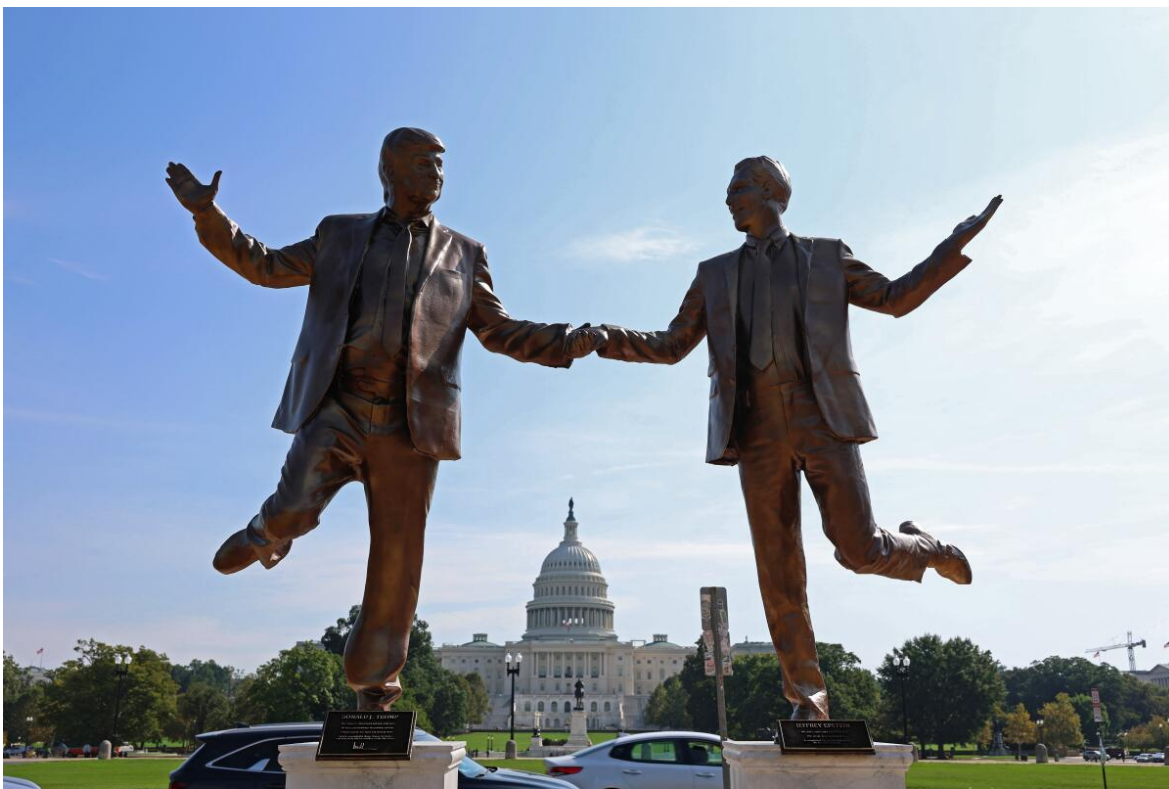
Una obra de arte de protesta que representaba al presidente Trump y a Jeffrey Epstein, apareció en septiembre del 2025 en la Explanada Nacional, cerca del Capitolio, en Washington D.C. "Mejores amigos para siempre", decía la inscripción en una placa ubicada debajo de las dos figuras que se tomaban de la mano

Ya nadie puede sorprenderse por el impresionante talento de Donald Trump para verter exabruptos cada vez que abre la boca. Sin duda es el mejor. Ya ha superado por mucho al ex primer ministro italiano Silvio Berlusconi, que su magnífico " culona inchiavabile ", refiriéndose al atractivo sexual de la canciller alemana Angela Merkel, construcción poética con la que no solo se ponía por sobre las figuras de Dante, Petrarca y Boccaccio, sino que establecía una marca en la diplomacia internacional que nadie superó hasta la llegada de Trump.