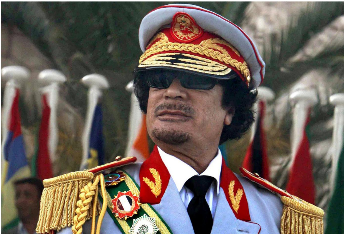
Muammar al-Gaddafi, líder libio depuesto y asesinado por occidente.

En el contexto del maremágnum libio, que se inició en 2011 con la operación que derrocó y asesinó al coronel Muhammad Gaddafi, sus hijos también han sido víctimas del odio desenfrenado que Occidente tuvo hacia su padre.